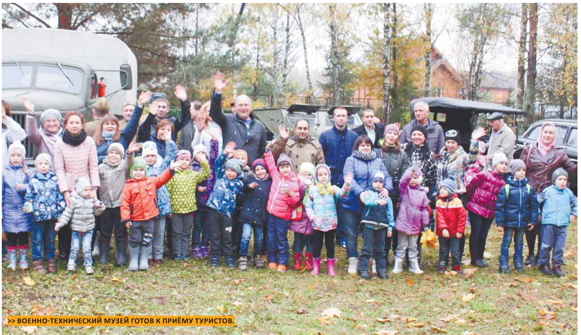
>> ВОЕННО-ТЕХНИЧЕСКИЙ МУЗЕЙ ГОТОВ К ПРИЁМУ ТУРИСТОВ.

ВОЕННО-ТЕХНИЧЕСКИЙ МУЗЕЙ РАЗРАБОТАЛ ТУРИСТИЧЕСКИЙ МАРШРУТ К ЧМ-2018